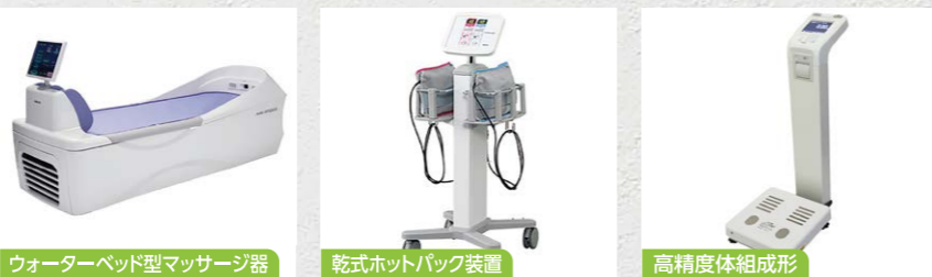
ウォーターベッド型マッサージ器