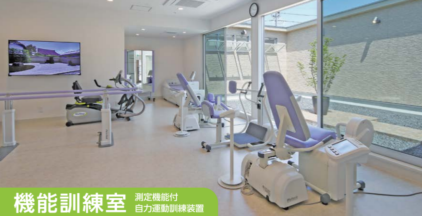
機能訓練室 測定機能付 自力運動訓練装置

常勤の理学療法士が一人ひとりに合わせた身体機能の維持・向上を目的とした無理なく最大限効果が上がるプログラムを作成します。陽射しが降りそそぐ中庭を眺めながら体を動かし、心身ともに健やかに過ごせます。